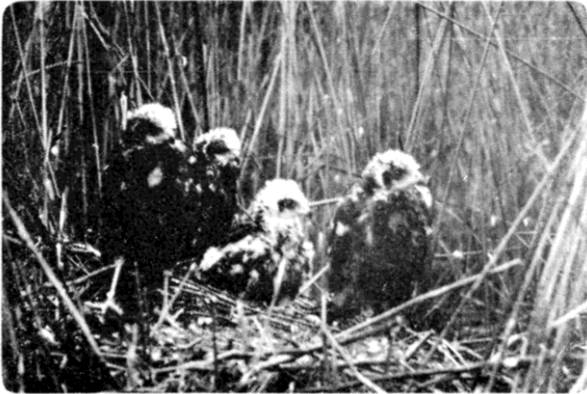
Bo av brun kärrhök, Kilsviken.

Vid en inventering av brun kärrhök ( Circus aeruginosus ) i Sverige 1958 av Anders Enemar, skattades det häckande beståndet till minst 150 par.* Rapporterna från nordöstra delen av Vänerområdet var bristfälliga, varför några uppgifter om brun kärrhök i detta område kunde vara av intresse. Området, som här avses, sträcker sig från de grunda vikarna Arnöfjärden i Väse och Ölmeviken väster om Kristinehamn till Åråsviken fyra mil söder om staden.