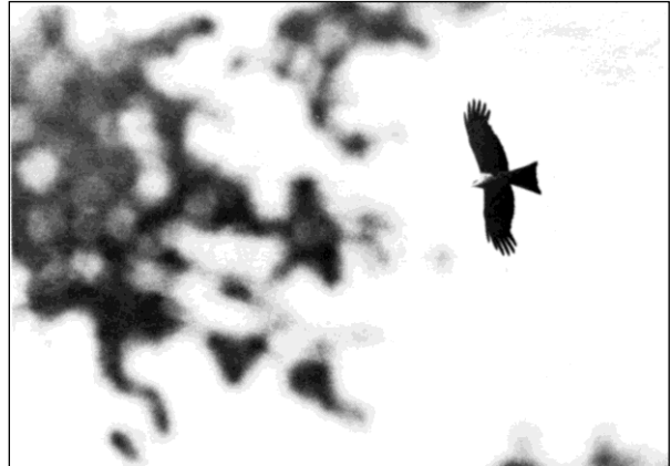
Den bruna gladan vid Ölmeviken.

par. Det dröjer en stund innan de stora fransade vingarna förmått höja fågeln upp i luften. Sakta och tungt stiger han, och i klorna sprattlar en stor, gulfärgad braxen. Det lär ha förekommit att fiskgjusen har misstagit sig på framförallt gäddans storlek eller på sin egen förmåga och dragits ner och dränkts, då rovfågelsklorna ej förmått släppa sitt tag om fisken. I några sådana fall lär gäddan ha överlevt och fortsatt sitt liv med fiskgjusens skelett som en makaber ryggprydnad. Berättelser om sådana s.k. krongäddor har bl.a. fascinerat Gunnar Brusewitz, som återkommer till detta fenomen i flera av sina fina böcker.