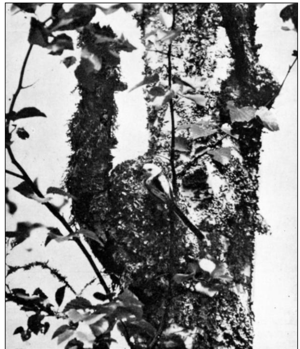
Stjärtmes vid boet

Det är givet, att så goda fågelmarker som dessa måste locka även förbisträckande att rasta, särskilt som de ligga utefter en gammal flyttningsled. Man kan träffa på dem litet varstans, svanar, änder och skrakar i de första reningarna, sjöfågeln är ju lättast att upptäcka. I gräsmarkerna vid Torsbotten, där tranorna från Stormossen ibland fånga grodor, t. o. m. sädgäss. Vadare slå ned på dybankar och stränder, eller om de kanske blott flyga över, förråda de sig dock i regel genom lockropen.