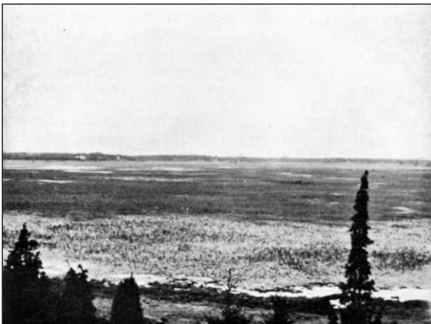
De stora vassarna mellan Hygn och Nynäs.

Någonstans härute bruka knölsvanarna dra ihop sin väldiga stack av säv och fjolårsvass till bo. Första försöket till häckning gjordes 1939, men av okänd anledning höll ej bobalen, och äggen flöto starkt ruvade bort. Följande år lyckades det bättre och nu har Kilsviken en egen svanstam. År 1943 häckade sålunda 3 eller 4 par, men hur många ungar, som till slut blevo flygga, är ovisst.