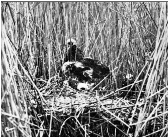
Bo av brun kärrhök.

Ännu något längre söderut på Nötön och Arskagen bereder lövskogen idealiska häckningsmöjligheter för småfågel i den snåriga undervegetationen. Buskar av olvon, try och björnhallon omväxla med höga, otillgängliga törnsnår och ibland öppna, stundom igenväxande hassellundar. Utåt tuvmarkerna avslutas holmarna ofta av en häck djungelartade videsnår. På många ställen inne i den uppväxande blandskogen hittar man bland gran och björk väldiga stubbar av ek och lind. Man blir sorgsen till sinnes, då man förstår vilken underbar ekskog, som här måste ha skövplats, då resterna av den ännu bildar dungar och lunder, som på få andra ställen i våra trakter.