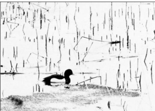
Så snart isen smält visar sig ofta viggen bland resterna av fjolårsvassen.

En majdag 1937 såg jag omkring 300 större pipare i snabb flykt mot norr över Vålösundet och efter en båtfärd till Rörkollorna en stund senare ytterligare ca 300 kustpipare, som rastade där tillsammans med några kustsnäppor.