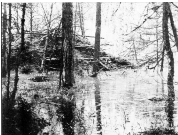
Bäverhydda vid Grytingskogen.

De vidsträckta kalhyggen som möter den nutida besökaren har säkerligen varit en av orsakerna till att fågellivet förändrats jämfört med 1930- och 40-talen. Då var det inte alls ovanligt att stöta upp några tjädrar utefter stigarna, men numera hör detta till undantagen. Fortfarande finns orrspele på några mossar, men de tidigare lekarna med 20—30 tuppar som "uppträdande" hör till en förgången tid. Å andra sidan kan man numera träffa på arter som tidigare inte fanns här. Exempel på sådana är korp och tretåig hackspett. Att korpen häckar i trakten konstaterades härom året. Däremot finns, såvitt jag vet, inget bofynd av tretåingen. Denna art har jag dock sett på flera ställen inom området både under häckningstid och annars. Korpen är ju en vacker fågel och jag har åtskilliga gånger haft turen att få se de stora, svartglänsande fåglarna med den väldiga "huggaren". Under soliga senvinterdagar kan man få höra deras klangfulla parningslåten — ibland även deras vanligare "korr"-rop. Korpen ansågs redan i den grå forntiden vara en klok fågel — som bekant hade Oden korparna Hugin och Munin som rådgivare.