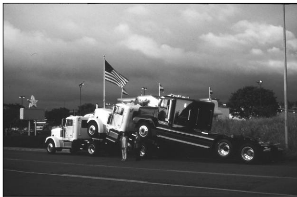
Transport i ett i-land.

Oftast sker transportererna med bränsleslukande båtar och lastbilar, som vräker ur sig farliga avgaser. I de industrialiserade länderna sker ofta produktionen med ideal om ett maximum av avkastning till ett maximum av risk.