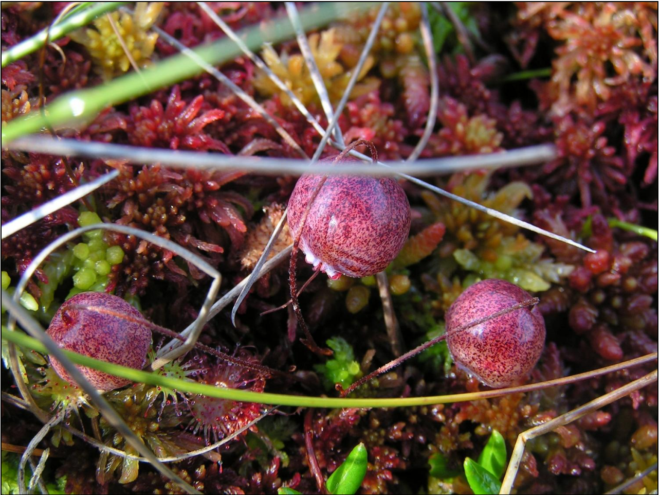
Tranbär och sileshår