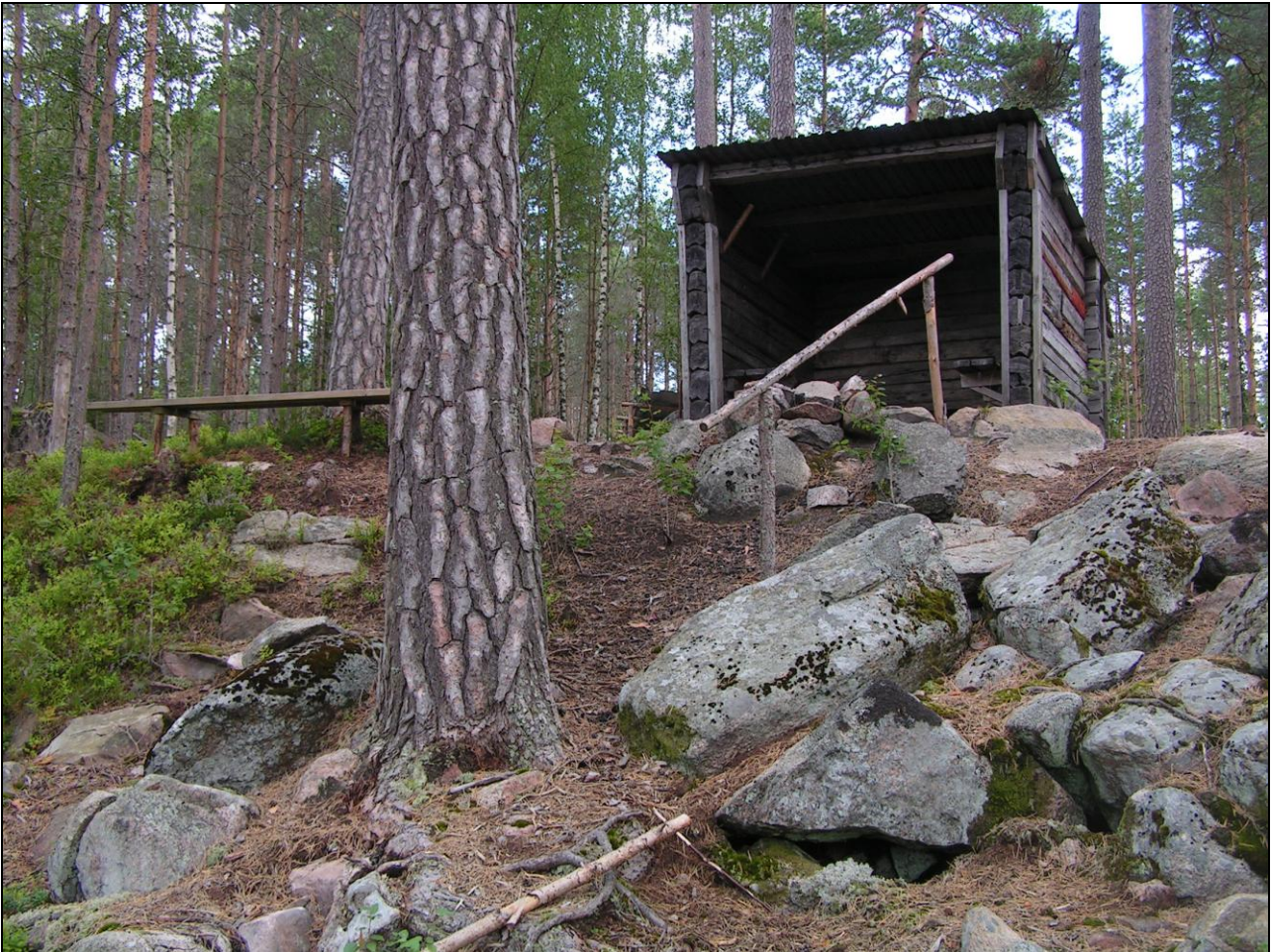
Vindskydd med grillplats