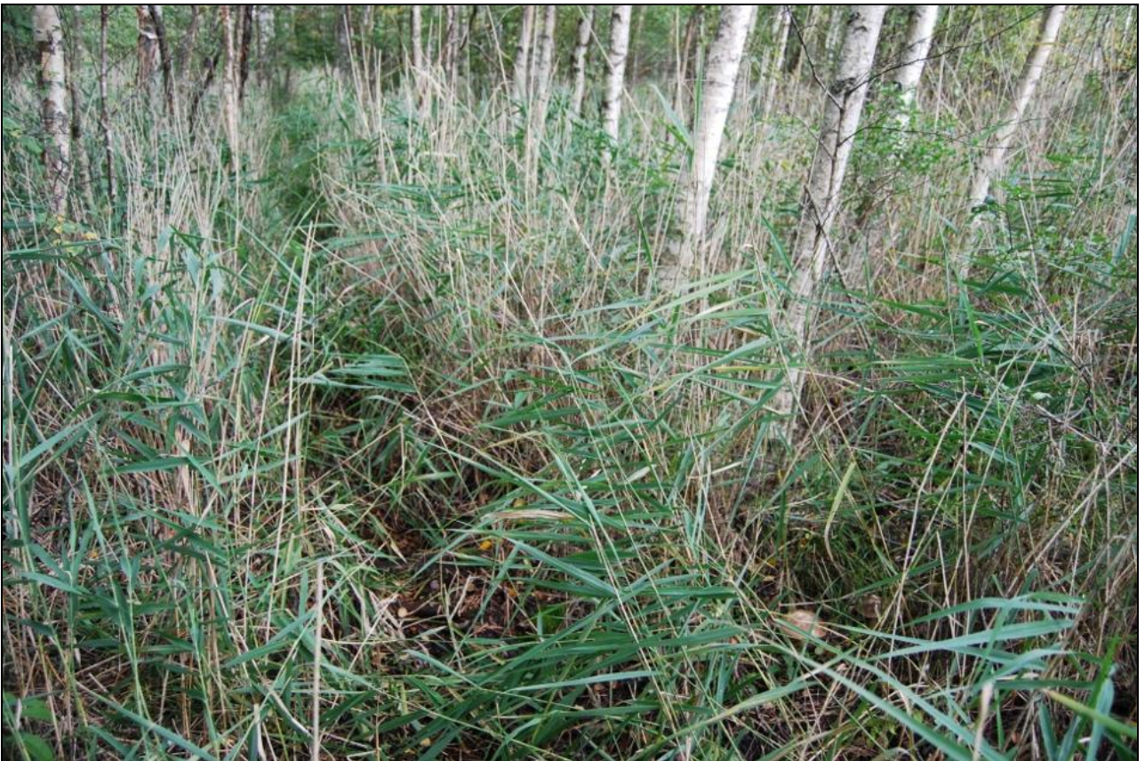
UPPTRAMPAD VÄG EFTER KLÖVVILT