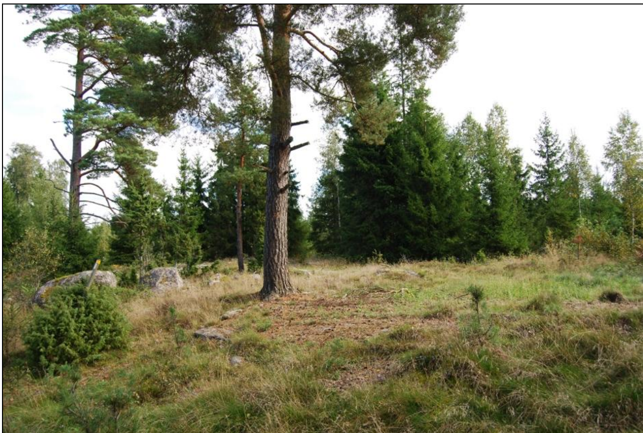
TORPLÄMNING EFTER TORPET TJÄRN