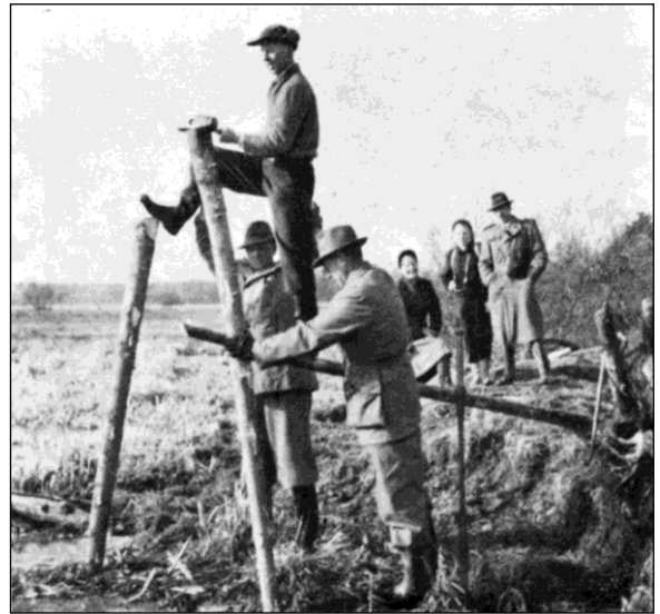
Broslagning.