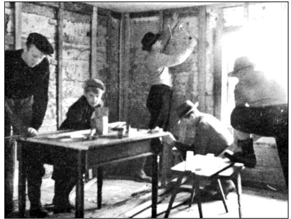
Renovering av »finrummet» — Många händer små gör ett gott arbete.