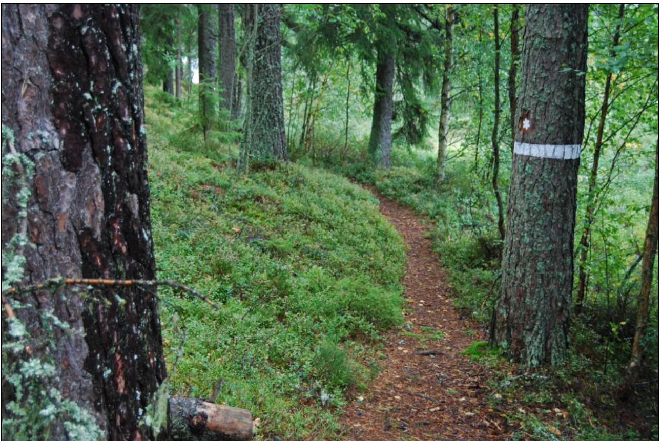
Stig i naturreservatet