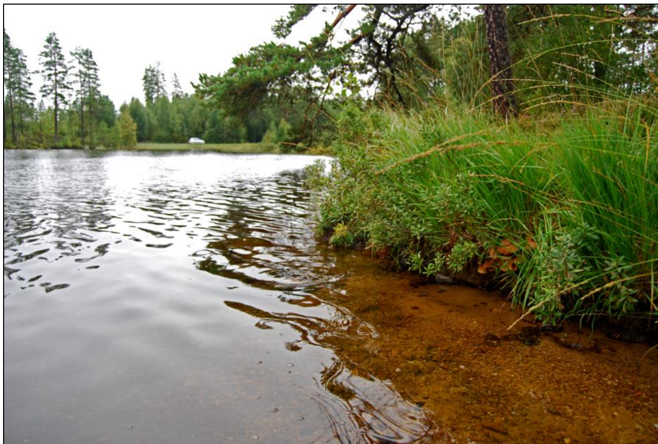
Stora Vilångens södra del och utlopp