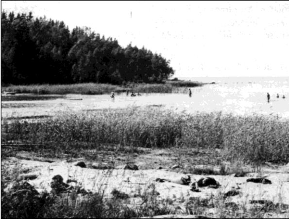
Badplatsen vid Baggeruds fritidsområde.