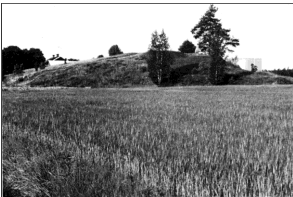
Sommerstaåsen, Visnums-Kil, synlig från riksväg 64.

Under förutsättning att sjöns vattennivå hålles tämligen konstant och om igenväxningen inte blir för kraftig, har man alla skäl att hoppas på en god framtid för Baksjön som fågelsjö.