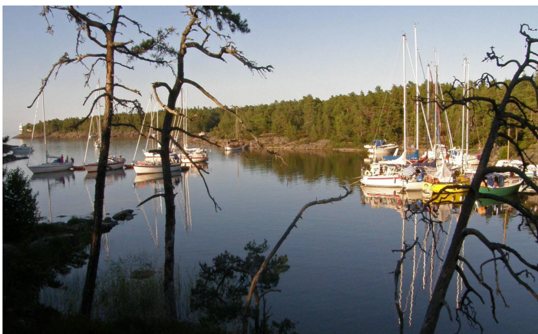
Malbergshamn väl skyddad men öppen för nordlig vind och sjö.