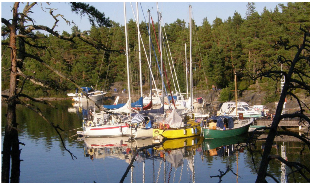
Trångt vid bryggan i Malbergshamn.