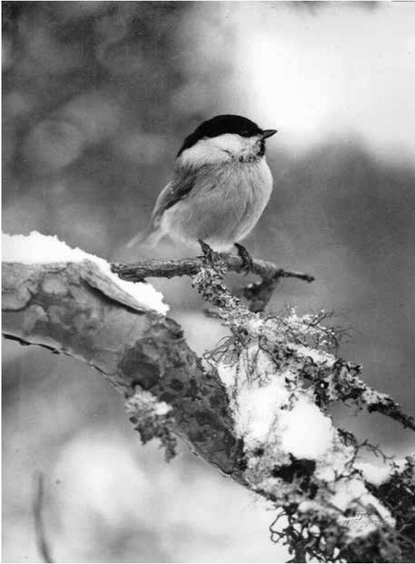
Detta foto på talltita är en av Evert Nyqvists mest kända fågelbilder. Först publicerad i Sällskapetets jubileumsskrift 1934–1944 och sedan i det stora verket "Våra fåglar i Norden".

i veckan till vaktmästaren som städade. Vi tittade i lådan och det stod "Homo sapiens, svanskotor saknas, 1823" på den. Det var en gammal lappgubbe som vi hade legat över under en veckas tid.