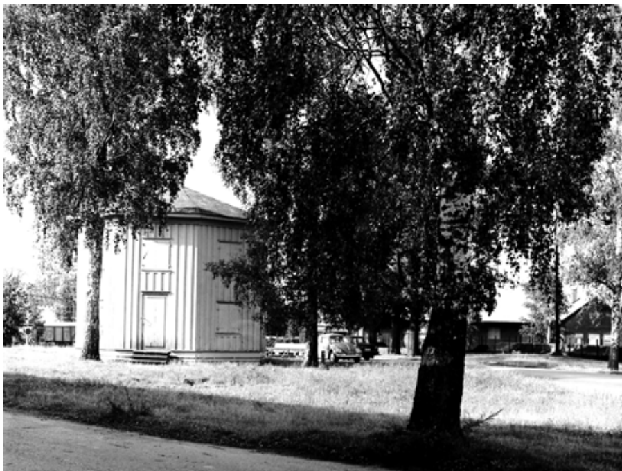
Attkantslunden vid Östra stationen i Karlstad. Fotot troligen taget vid mitten av 1960-talet.

kunde hända här. Det blev mobilisering. Det var första gången jag hörde det ordet, men det fick en lära sig ordentligt utan å innan. Hur det stavades och det förekom på affischer å anslagstavler. Jag kunde läsa när jag började småskolan, men det var ett ord som jag fäste mig för och som jag inte begrep – det var ”kungörelse”. Jag läste ut det där ordet som ”kung-örelse”. Att det var kung med i’et, det kunde jag fatta, men det där ”örelse” hade jag ingen aning om vad det betydde. Det var ju bara det att jag missuppfatta; lätt att göra för vem som helst, men ett ganska svårt ord, åtminstone för de mindre.