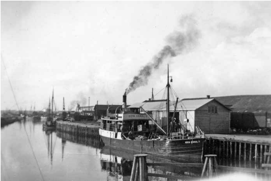
Båten Göta kanal II vid kaj i Kristinehamns hamn på 1920-talet.